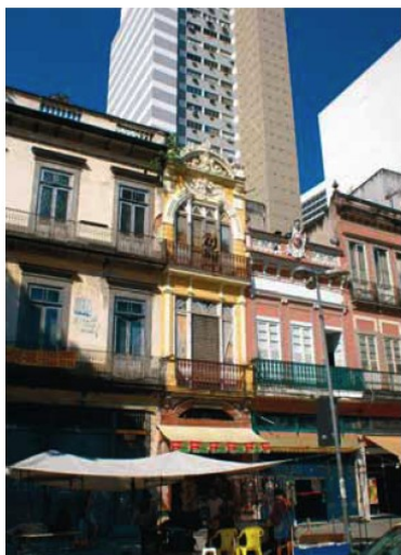
Centre de Rio de Janeiro

« Mais qu'est-ce que vont bien pouvoir raconter des (ex-) architectes des bâtiments de France au Forum urbain mondial, où les préoccupations affichées sont avant tout sociales ? »