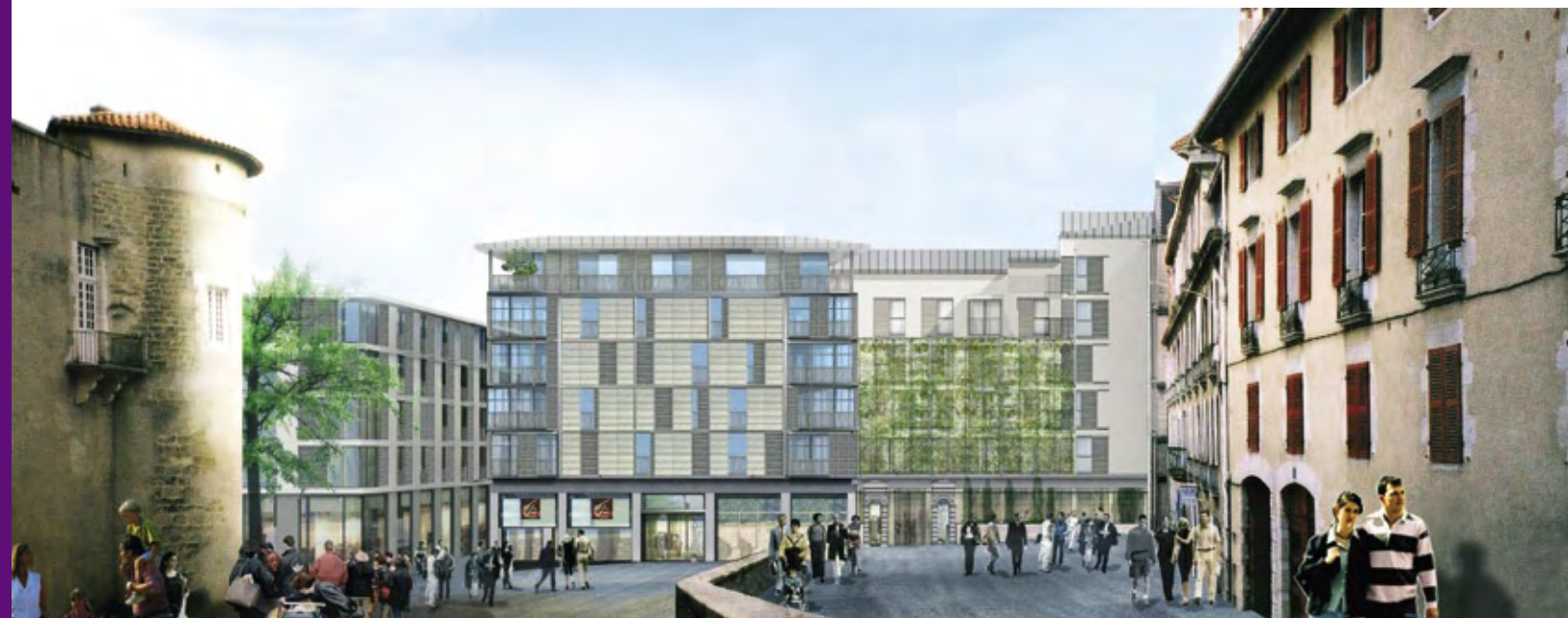
Le projet Icade situé en cœur de Ville accueillera le futur CIAP