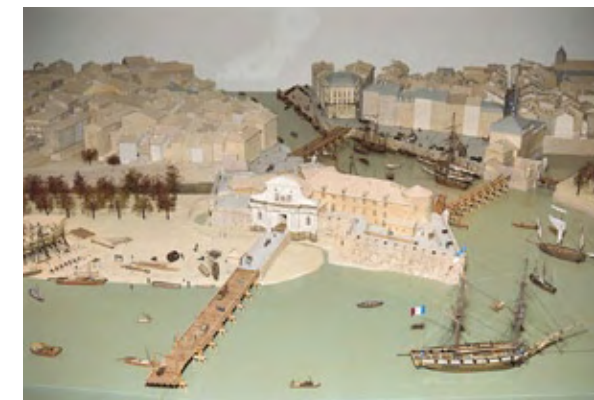
Maquette de Bayonne, coll. musée Basque

Ce principe de mise en réseau des équipements répond à l'objectif de la ville de développer une politique globale de médiation sur la ville, en s'appuyant sur les dispositifs existants.