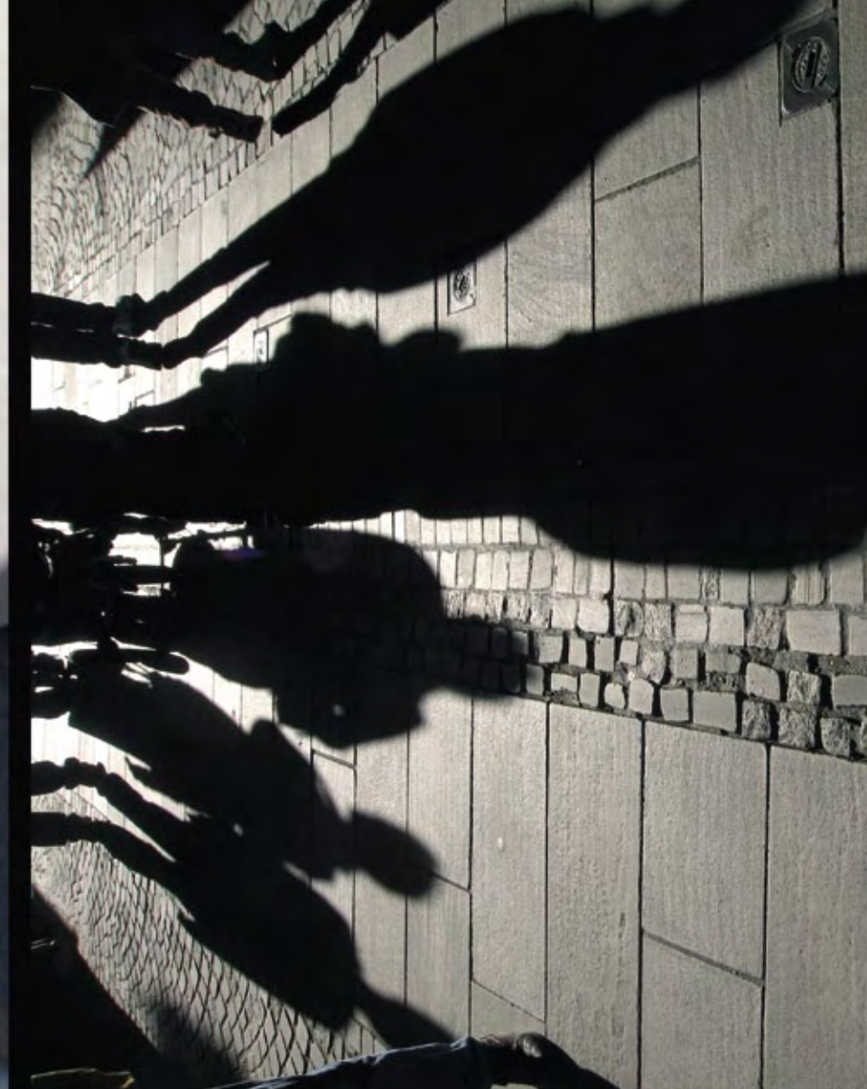
Les bords de la Nive, côté Petit Bayonne